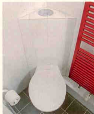
Platzgewinn durch Ecklösung.

gleich zu konventionellen Spülkästen erzielt die kompakte Ecklösung (minimale Einbaumaße von 297 mal 210 mal 420 Millimetern) mit rundem Spülbehälter einen Platzgewinn von 0,25 Quadratmetern und mehr. Darüber hinaus zeichnet sich das universell einsetzbare Sechsliter-Spülsystem durch hohen Schallschutz aus. Mit einem Schallpegel von nur 19 dB(A) ist es sehr leise und verursacht keine lästigen Funktionsgeräusche. Das trägt entscheidend zum Wohlbefinden der Hotelgäste bei.