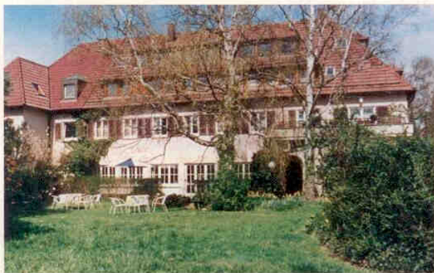
Die Badrenovierung hat sich gelohnt: Das Hotel „Bürkle“ in Fellbach führt jetzt drei Sterne.