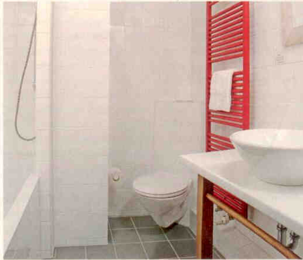
Die neuen Bäder zeichnet modernes Design aus.

Zunächst allerdings schien das Renovierungsvorhaben an den engen Platzverhältnissen des Altbaus und der ungünstigen Lage der Versorgungs- und vor allem der Abwasserleitungen zu scheitern. Ein weiteres Problem: Mit dem Einbau eines großvolumigen Spülkastens ließ sich eine komfortable Badgestaltung auf den wenigen Quadratmetern nicht realisieren. Die Lösung bot das Kompakt-Spülrohr der Firma Missel. Im Ver-